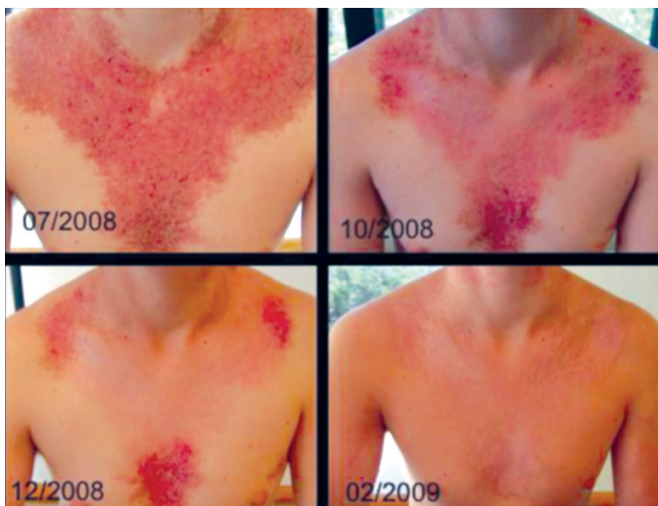
FIGURA 5. Evolución clínica de paciente con enfermedad de Darier en tratamiento con isotretinoína oral 0,7 mg/kg/día.

Sin embargo, pacientes con enfermedad grave requieren tratamientos sistémicos. Los retinoides orales, como la isotretinoína y el acitretín, presentan buenos resultados transitorios. 8 Son muy eficaces para reducir la hiperqueratosis y el componente papuloso de la erupción, lo cual podría ser secundario a los cambios dinámicos del cal-