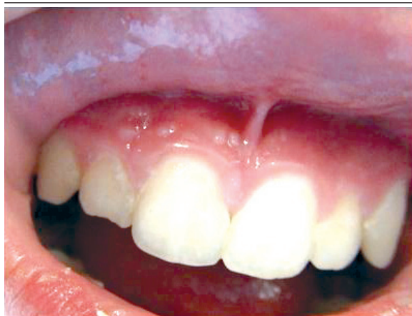
FIGURA 2. Mucosa oral: pápulas blanquecinas con umbilicación central en encías superiores.

Entre los desencadenantes de la EDW se conocen el calor, la humedad, la radiación ultravioleta, los traumas mecánicos y el litio oral. Ciertas infecciones virales y microbianas suelen agravar la enfermedad.