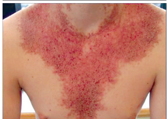
FIGURA 1. Pápulas poligonales rugosas cubiertas por escamocostras amarillento parduscas que se agminaban formando placas localizadas en frente, cuero cabelludo, zona retroauricular, caras laterales de cuello, nuca y "V" del escote.

Paciente masculino de 16 años que consultó por lesiones de piel de 10 años de evolución. No refería antecedentes personales o familiares de importancia. Al examen físico se evidenciaron pápulas poligonales rugosas cubiertas por escamocostras amarillento-parduscas, que se agrupaban formando placas localizadas en frente, cuero cabelludo, zona retroauricular, caras laterales de cuello, nuca y "V" del escote ( Foto 1 ). En la mucosa oral, presentaba pápulas blanquecinas con umbilicación central en encías superiores ( Foto 2 ). A nivel ungueal presentaba indentación en "V" en el borde libre del pulgar derecho, surcos longitudinales y líneas blancas y rojas, paralelas al eje mayor de la uña del dedo medio izquierdo ( Foto 3 ). Se realizó biopsia de piel que evidenció paraqueratosis focal, células disqueratósicas y sectores de acantólisis suprabasal. Cuerpos redondos, granos y leves infiltrados perivasculares en dermis