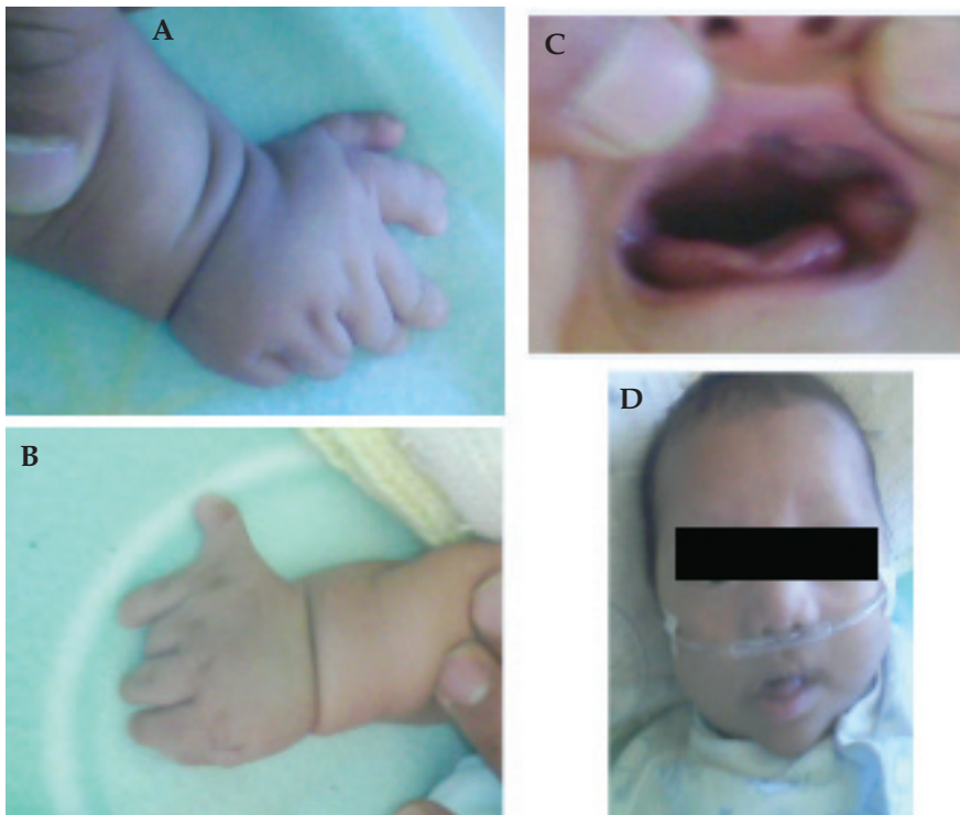
FIGURA 1. A y B. Polidactilia bilateral de las manos. C. Labio superior fusionado al paladar. D. Fotografía frontal del paciente.

Durante la evolución, el paciente se mantuvo hemodinámicamente estable y no presentó hipertensión pulmonar. Se recomendó a los padres evitar situaciones que incrementaran el gasto cardíaco, incluidos los viajes a ciudades de gran altitud. El paciente fue referido para evaluación especializada a un establecimiento de mayor capacidad resolutive.