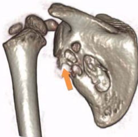
FIGURA 3. Tomografía axial computada del hombro y la escápula con reconstrucción 3D. Se observan lesiones de tipo osteolítico en el borde lateral y en la cara costal de la escápula

La biopsia ósea informó un cuadro histopatológico semejante al anterior, con