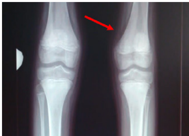
FIGURA 3. Radiografía de frente de miembros inferiores: se observa despegamiento perióstico a nivel femoral distal bilateral

Se inició tratamiento específico con vitamina C por vía oral, según el protocolo para escorbuto: dosis de carga de 1000 mg/día durante 14 días y una dosis de mantenimiento de 500 mg/día. Se indicaron, además, suplementos con micronutrientes no consumidos en la dieta habitual. Al séptimo día de iniciado el tratamiento, se constató recuperación progresiva de la fuerza muscular, con disminución en la intensidad y frecuencia de las mialgias. A los quince días, se alcanzó la bipedestación y la