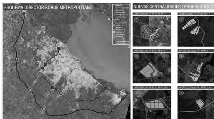
Figura 3: Propuesta.