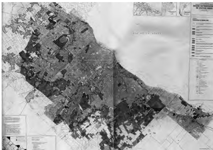
Figura 2: Plano de usos del territorio de borde de Buenos Aires.