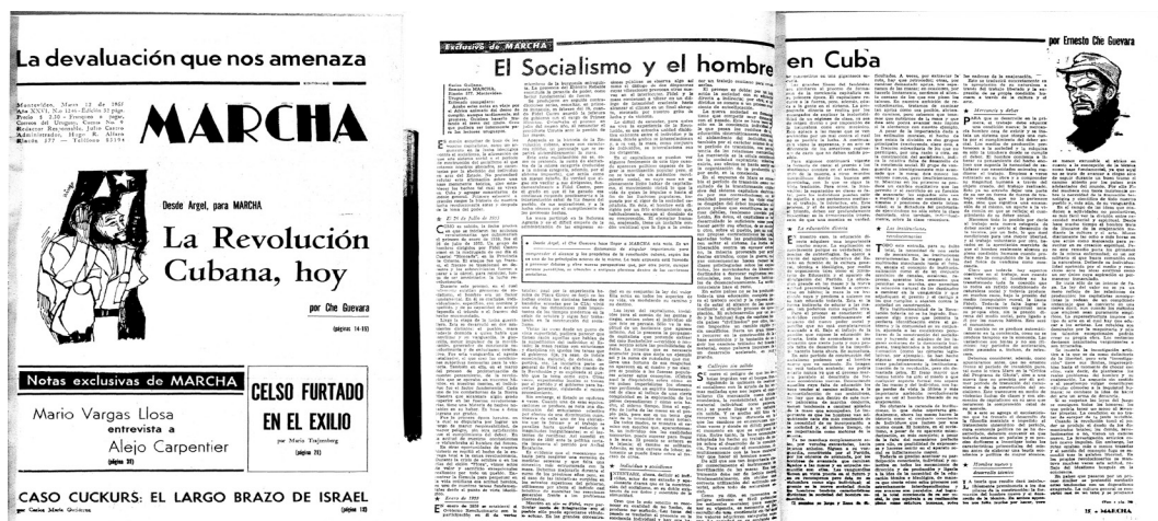
Figura 2: Portada y artículo El Socialismo y el hombre en Cuba de la revista Marcha del 12 de marzo de 1965.