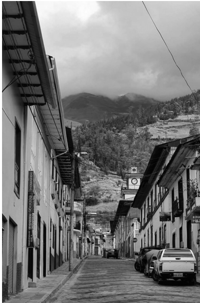
Figura 6: Lo colonial y natural. La arquitectura presente en el centro histórico de Alausí y su paisaje natural como elementos componentes del Paisaje Urbano Histórico.

La gestión y conservación de su PUH responde a una imagen futura con carácter y calidad, en donde prevalezcan los usos tradicionales, los espacios públicos y las áreas verdes como plazas y parques. Esto incluye las visuales propias de su topografía, miradores y colinas.