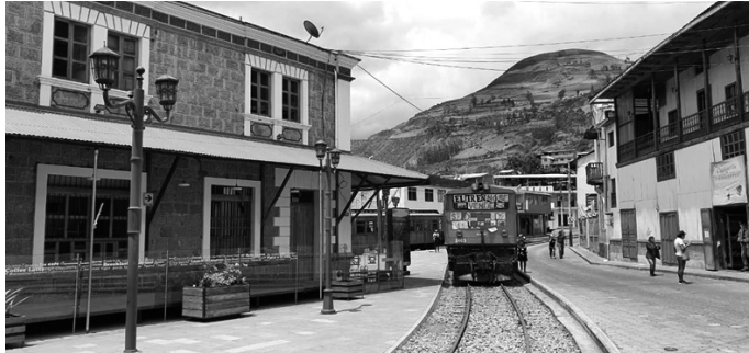
Figura 4: El ferrocarril. El ferrocarril como uno de los cinco patrimonios que conforman el Paisaje Urbano Histórico de Alausí.