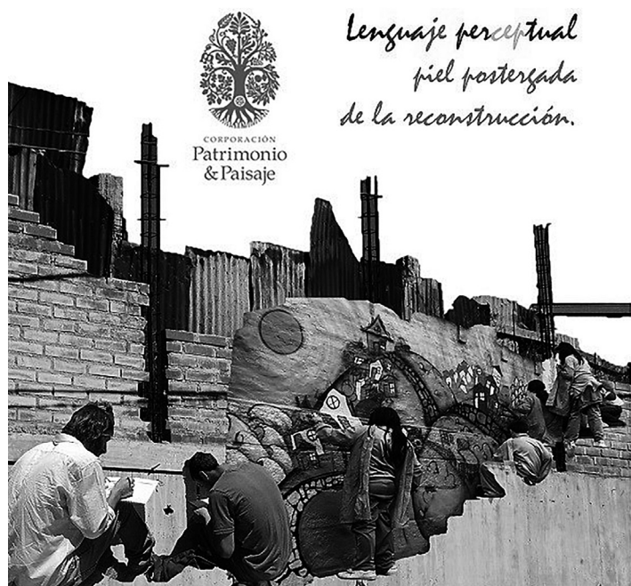
Figura 6: Poster del Taller “Lenguaje Perceptual del Paisaje, piel postergada de la reconstrucción”.