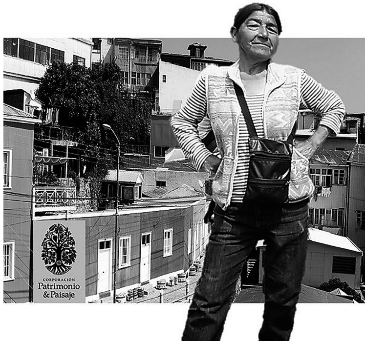
Figura 4: Valparaíso y comunidad empoderada.