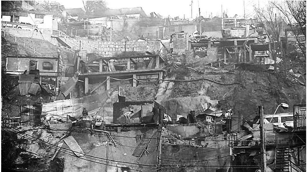
Figura 1: Devastación a causa del incendio en uno de los cerros de Valparaíso.

Anales del IAA #52 (2) - julio / diciembre de 2022 - (1-10) - ISSN 2362-2024