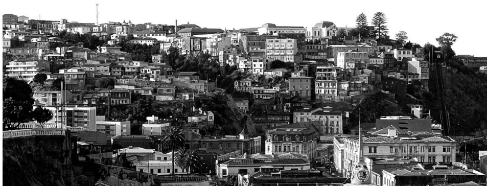
Figura 2: Vista hacia uno de los cerros de Valparaíso, con sus coloridos y texturas.

Anales del IAA #52 (2) - julio / diciembre de 2022 - (1-10) - ISSN 2362-2024