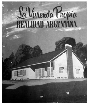
Figura 9: Tapa con una vivienda californiana.

Anales del IAA #53 (2) - julio / diciembre de 2023 - (1-14) - ISSN 2362-2024