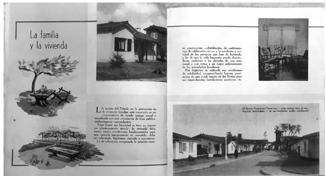
Figura 10: Vivienda californiana.