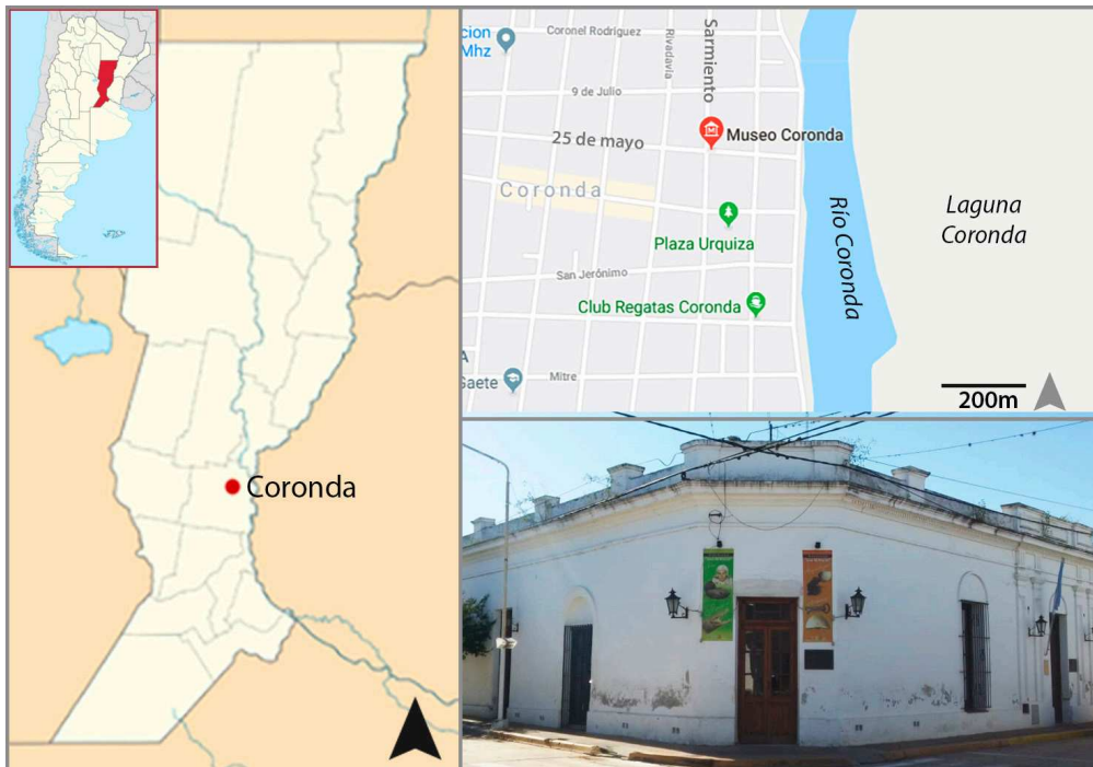
Figura 1. Ubicación y fachada actual del Museo Municipal José Manuel Maciel de la ciudad de Coronda, provincia de Santa Fe.