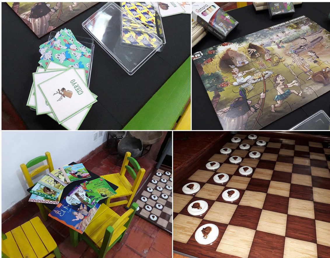
Figura 5. Recursos didácticos elaborados para la sala de arqueología del Museo Municipal José Manuel Maciel (Coronda, Santa Fe).