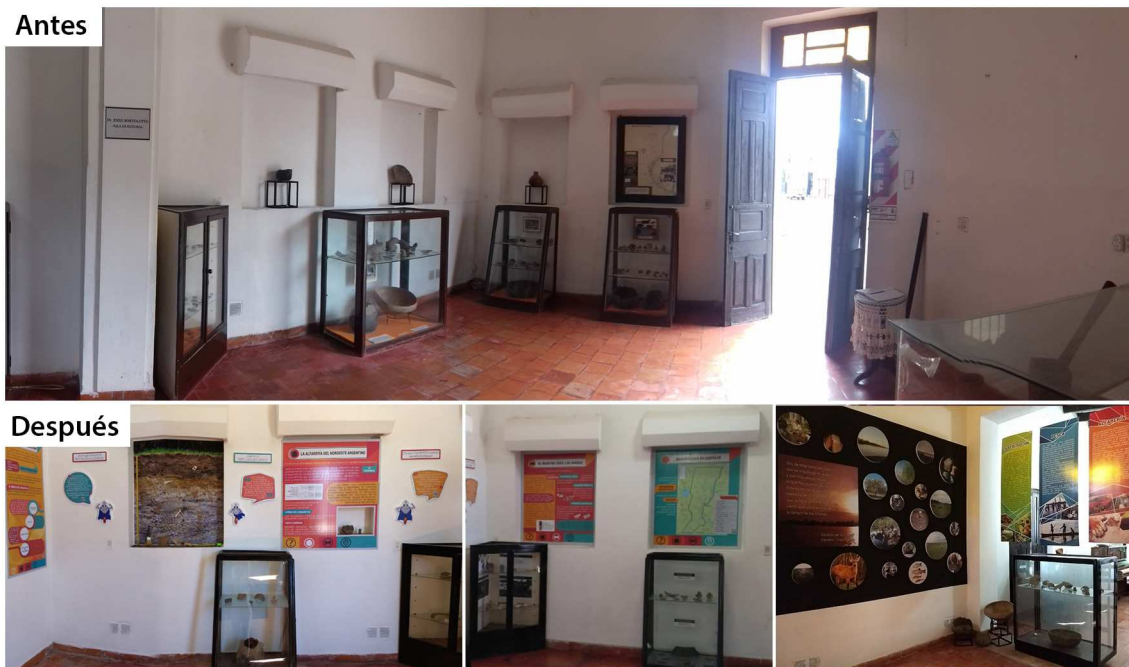
Figura 3. Vistas de la sala de arqueología del Museo Municipal José Manuel Maciel (Coronda, Santa Fe) antes (arriba) y después (abajo) del desarrollo del proyecto “Sorteando los avatares del tiempo: al rescate del patrimonio”.

En total, la nueva muestra quedó organizada en 5 sectores, en los cuales se trataron los siguientes tópicos: