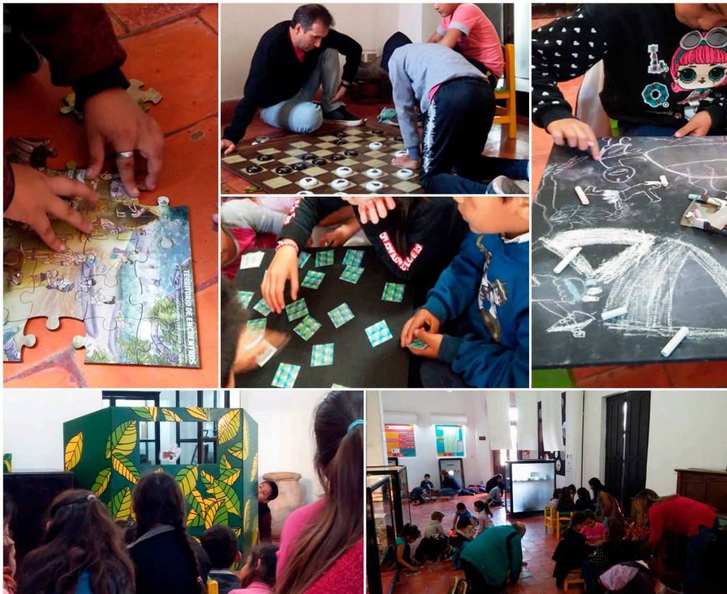
Figura 7. Visitantes escolares interactuando con los recursos didácticos.

relativamente recientes 29 , es de gran relevancia acompañar estos procesos desde los diferentes marcos educativos. A partir de los bienes patrimoniales puede potenciarse el conocimiento de los diferentes referentes identitarios y simbólicos de la sociedad en la que se inserta el museo, propendiendo a establecer criterios de tolerancia y respeto hacia otras formas de vida, ya sean pretéritas o actuales 30 .