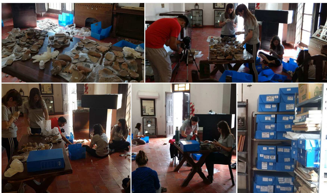
Figura 2. Tareas de acondicionamiento, inventariado y almacenaje de las colecciones presentes en el Museo Municipal José Manuel Maciel (Coronda, Santa Fe).

En forma sintética, las actividades que comprendieron la sistematización llevada a cabo fueron: limpieza, acondicionamiento y siglado de los materiales, registro de procedencia, toma de fotografías de cada objeto con escala y referencia,