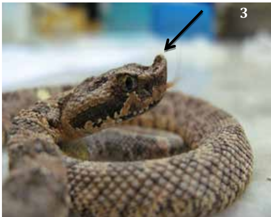
Figuras 3. Placas dérmicas se elevan sobre las narinas ("yarará ñata").