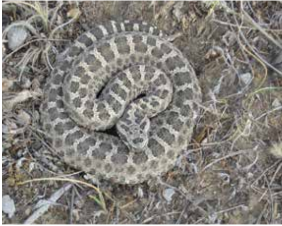
Figura 1. Patrón de dibujos de coloración marrón grisácea con manchas más oscuras.