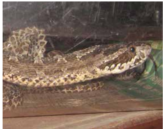
Figura 4. La terminación característica de su nariz, la diferencia del resto de las especies de Bothrops de Argentina, si bien en casos esa característica está ausente como en este ejemplar.

puede inyectar puede ser inferior al que inoculan otras especies de Bothrops de Argentina, de mayor tamaño que la "yarará ñata" (de Roodt y col. 2000).