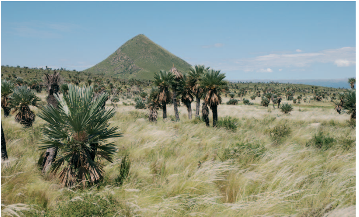
Fig. 4. Palmares de Trithrinax campestris en la Pampa de Pocho, entre las localidades de Taninga y Las Palmas, sector 6 de la excursión. En el primer plano se observan individuos de palma y al fondo la silueta del volcán Ciénaga o Boroa.