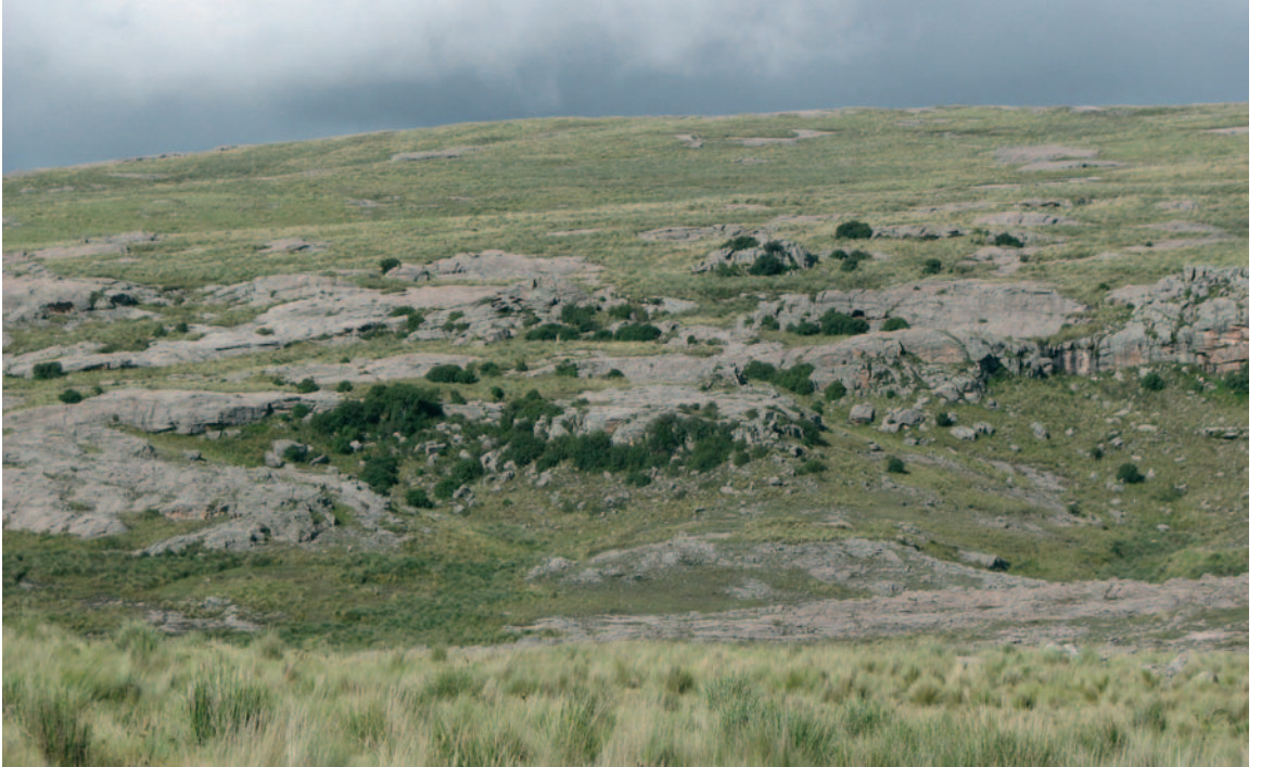
Fig. 3. Pastizales y Bosques de altura en Ea. La Trinidad, Parque Nacional Quebrada del Condorito. El paisaje corresponde a los sectores 3 y 4 del recorrido.