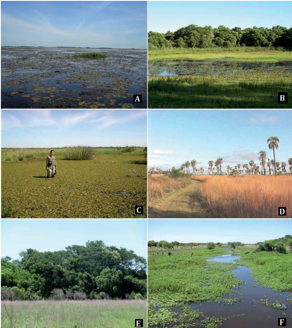
Fig. 1. Ambientes característicos del Parque Nacional Mburucuyá. A: Esteros de Santa Lucía. B: Vegetación asociada a lagunas transitorias. C: Población de Salvinia auriculata en zonas inundables. D: Palmar de Butia yatay y sabanas de Andropogon lateralis . E: Fisonomía externa de los Bosques higrófilos. F: Arroyo Portillo, con vegetación palustre asociada.