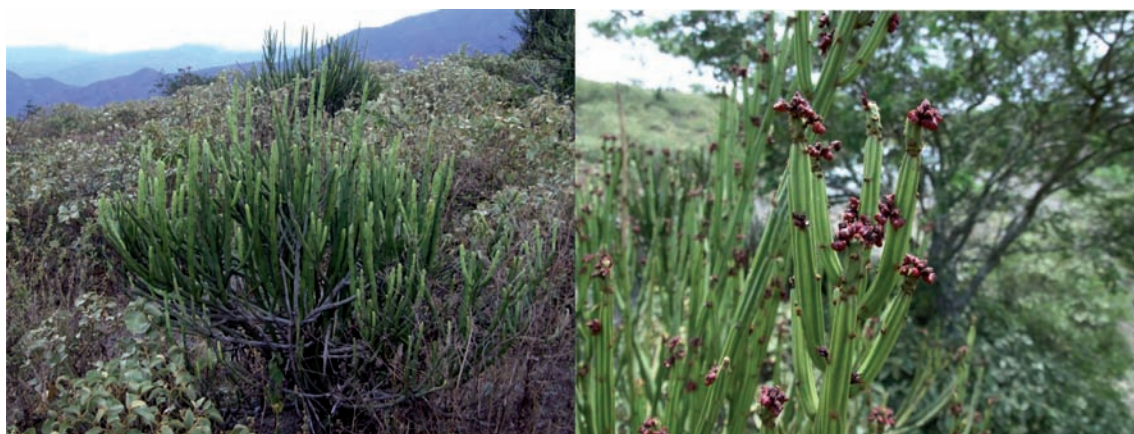
Fig. 1. Ejemplar de E. weberbaueri . A: hábito (O. Cabrera y A. Prina 087, HUTPL). B: rama florífera (O. Cabrera y A. Prina 060, HUTPL).

Material estudiado: ECUADOR. Prov. Loja: Cantón Catamayo , San Bartolo, 79° 26'52''W-3° 38'S, 1980 msm, 25-VIII-1982, L. Emperaire