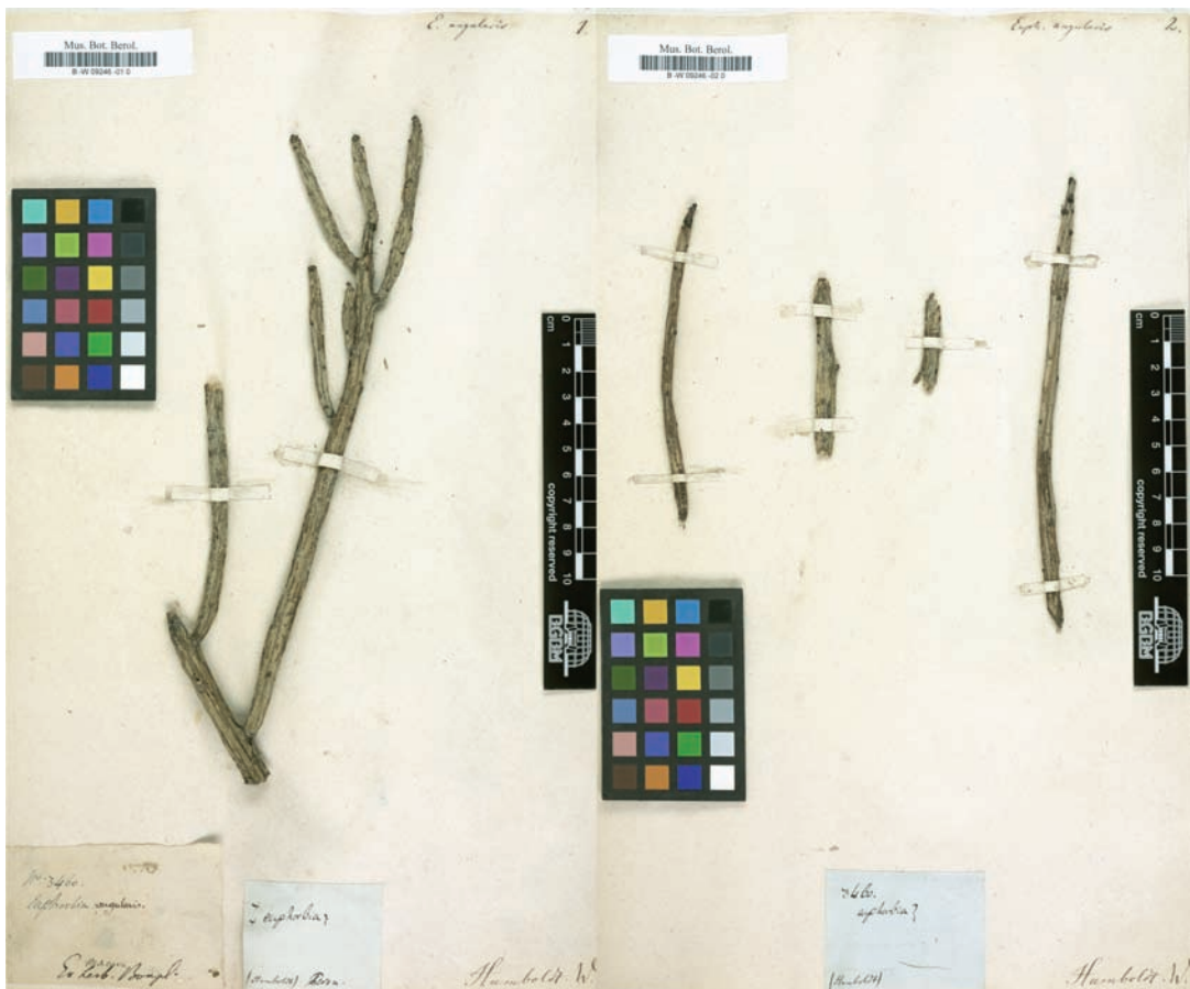
Fig. 2. Espécimen de E. weberbaueri (A. Bonpland y A. von Humboldt 3460 B).

Entre 1802 y 1803, A. Bonpland y A. von Humboldt fueron los primeros botánicos europeos que colectaron plantas ecuatorianas que llegaron con éxito a Europa, siendo utilizadas para describir varios taxones nuevos (Jørgensen & León Yáñez, 1999). Una de esas colecciones reposa en el Herbario de Berlín (B), consta de dos pliegos y esta signada con el número 3460 (Fig. 2); se trataría de la primera colección de E. weberbaueri realizada en Ecuador y probablemente en Sudamérica. Fue identificada por los colectores como Euphorbia angularis , una especie africana que no se encuentra en América. La etiqueta de herbario indica la localidad de colección como "Macará, Perú"; esta localidad pertenece actualmente a Ecuador próxima al límite con Perú, al sur de la provincia de Loja. La descripción de la especie la realizó R. Mansfeld,