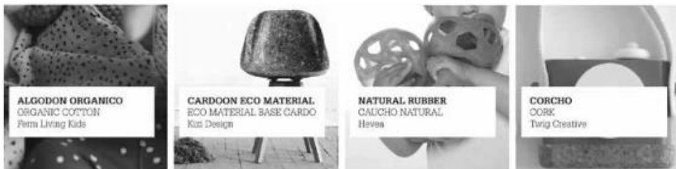
Figura 3. Paleta de materiales de Kids Trends Book .