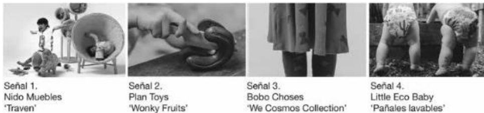
Figura 1. Señales de Kids Trends Book 2022 .

‘señales’ adquieren valor proyectual. De hecho, la herramienta Kids Trends Book facilita una paleta cromática y de materiales que funcionan como guía de estilo de la que partir para el desarrollo ulterior dependiendo del tipo de proyecto.