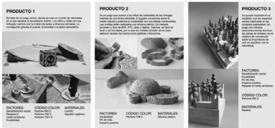
Figura 4. Guía de diseño.

El contexto social es el segundo parámetro donde se evidencian los factores que ofrece el producto en base a los indicadores de la tendencia. A través de los estilos de vida observados se establecen los principios de sostenibilidad que deben abordar los productos diseñados: respeta el medio ambiente, durabilidad, fin de vida, sensibilización social e impacto positivo.