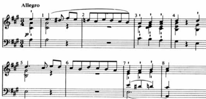
W. A. Mozart, Cuarteto de cuerda en La m., KV 464, primer movimiento