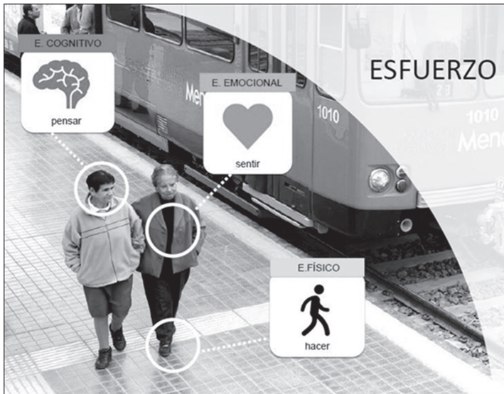
Figura 4. El esfuerzo humano se presenta como una variable tridimensional: esfuerzo físico, esfuerzo emocional y esfuerzo cognitivo.