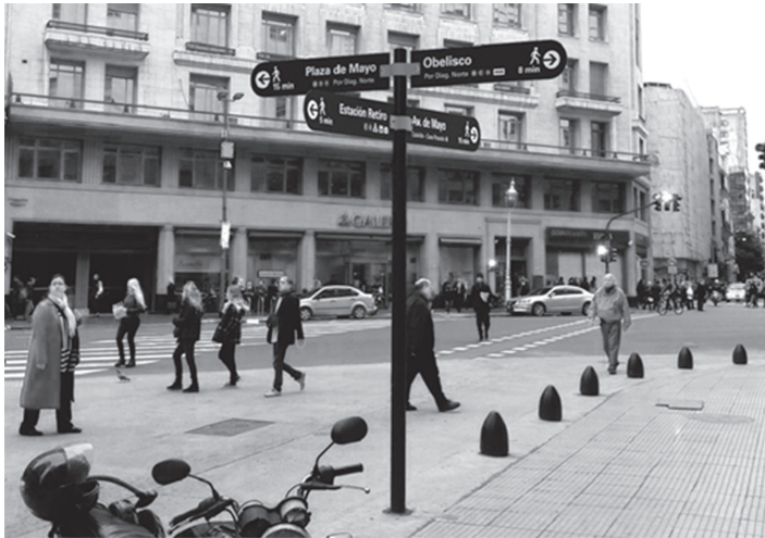
Figura 5. Diseño a escala humana: Señalización pedestre en Buenos Aires.