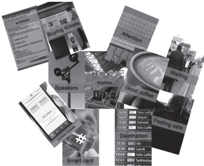
Figura 3. Experiencia de Usuario: Tarjetas que permiten describir los encuentros con elementos de interface del servicio. Fuente: Culén et al. 2014.