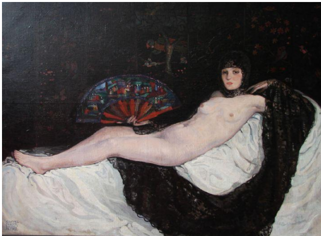
Figura 3. Gregorio López Naguil. "El chal negro" (1919). Fondo Nacional de las Artes, Buenos Aires

En la obra "Eslava" (1919) (Figura 4) de nuevo incorporó la laca como telón de fondo detrás de la figura representada. En este caso diferentes aves y vegetación entrelazada formaban la decoración que se hacía extensiva a toda la superficie. Se sirvió del tratamiento exótico en el trasfondo de la obra. El empaste presentado en la laca contrastó con el de las sedas transparentes, casi volátiles, de la indumentaria. A través de la figura, y por el mismo título de la obra, advertimos una nueva temática. La figura y su indumentaria nos acercan al mundo de las danzas orientales y reflejan la incidencia de los Ballets Rusos de Serguei Diaghilev en la obra de Gregorio López Naguil. Recordemos que el artista se dedicó a la escenografía teatral y que ocupó diferentes cargos de dirección escenográfica. La compañía de Serguei Diaghilev estuvo de gira en Argentina los años 1913 y 1917, cuando nuestro pintor aún residía en Mallorca.