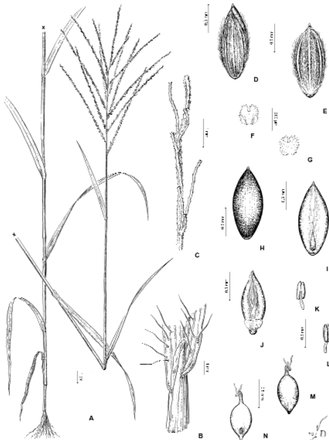
Fig. 3. Digitaria multiflora . A , hábito. B , lígula. C , fragmento del raquis con pedicelos desprovistos de espiguillas. D , espiguilla vista desde la gluma superior. E , espiguilla vista desde la gluma y lemma inferiores. F , pálea inferior, vista ventral. G , pálea inferior, vista dorsal. H , antecio superior, vista dorsal. I , antecio superior, vista ventral. J , pálea y lodículas de la flor superior. K-L , estambre. M , cariópsis, vista escutelar. N , cariópsis, vista hilar. De C. L. Lundell 6694 (US).