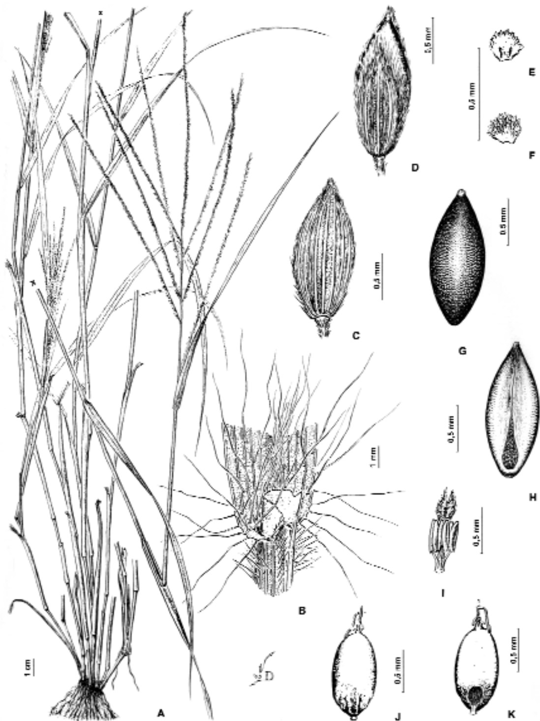
Fig. 1. Digitaria cayoensis . A , hábito. B , lígula. C , espiguilla vista desde la gluma y lemma inferiores. D , espiguilla vista desde la gluma superior. E , pálea inferior, vista ventral. F , pálea inferior, vista dorsal. G , antecio superior, vista dorsal. H , antecio superior, vista ventral. I , androceo y gineceo de la flor superior. J , cariópsis, vista escutelar. K , cariópsis, vista hilar. De C. L. Lundell 6670 (US).