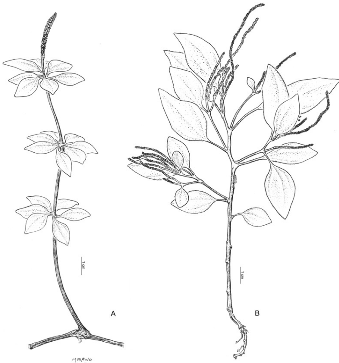
Fig 3. Peperomia trineuroides . A , aspecto general, de Biganzoli et al. 634 (SI). Peperomia diaphanoides . B , aspecto general, de Deginani et al. 1743 (SI).

Observaciones. Molino (1922: 145) cita un ejemplar de P. alata , Medinaceli s.n. , para la provincia de Jujuy, Departamento Tumbaya, sin indicar ningún herbario. Este ejemplar no fue localizado, por lo tanto no se confirma la presencia de la especie en la Argentina.