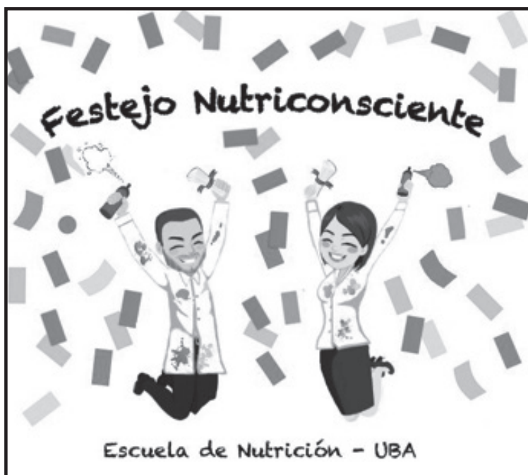
Logo festejo nutriconsciente

Asimismo, se recomienda reforzar el alcance de la intervención en las familias y amistades del graduado, así como también ampliar los contenidos utilizados para las infografías a publicar en las redes sociales, utilizando datos acerca de las cantidades de alimentos desperdiciados y el impacto generado por la intervención a un año de realizarla.