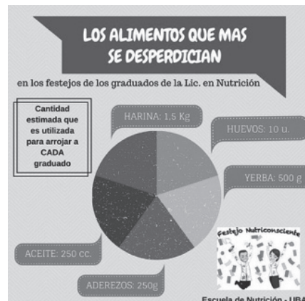
Flyer – cantidades desperdiciadas