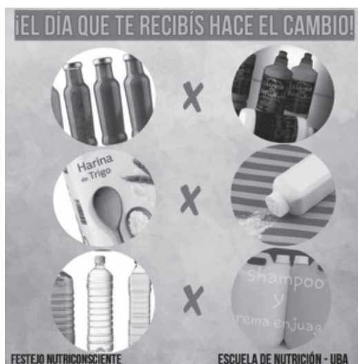
Flyers – reemplazos de alimentos.