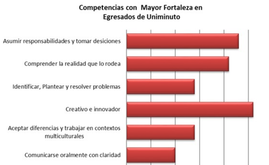
GRÁFICO 4. Competencias con mayor fortaleza egresados Uniminuto

La innovación y la creatividad sobresalen como las competencias más desarrolladas por los Egresados a través del programa de educación física ofrecido por Uniminuto. Otra de gran relevancia es la toma de decisiones y la responsabilidad que logra destacarse junto a la comprensión de la realidad que los rodea. Siendo de esta manera tres competencias por encima del 80% de acuerdo a la apreciación de los egresados. (Ver gráfico 4.)