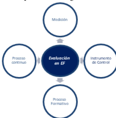
FIGURA 1. Sub-categorías que forman parte de la categoría evaluación en educación física

Desde el análisis de contenido emergieron dos categorías principales: 1) Evaluación en Educación Física, de la cual se desplegaron cuatro sub-categorías: a) Medición, b) Instrumento de control, c) Proceso continuo y, d) Proceso Formativo. La segunda: 2) Evaluación conceptual, de la cual forman parte tres sub-categorías: a) Cultura, b) Desarrollo Integral y, c) Transversalidad.