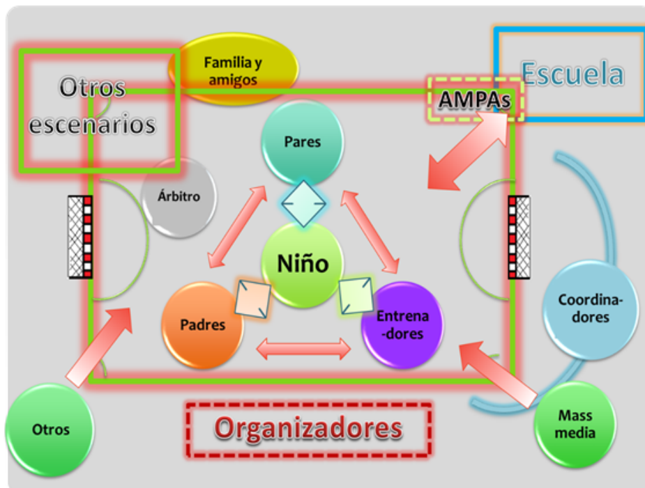
FIGURA 3 Esquema sintético del escenario de fútbol correspondiente a 7 y 8 años tras un análisis pormenorizado de todos los referentes que intervienen en la formación del niño.

Finalmente, se ha de considerar que de un modo institucional se concibe la formación físico-deportiva como la confluencia de la educación física, que se desarrolla en el colegio, y la actividad física desarrollada de modo libre como “complemento indispensable de la anterior” (Pastor, 2002, p. 16), por lo que implícitamente se reclama una comunicación entre el ambiente formal y no formal que establezca una pertinencia y adecuación de los aprendizajes que se promueven entre los alumnos/jóvenes deportistas para su práctica física habitual enfocada hacia la calidad de vida (Vizuet, 2013). La confluencia de todos estos referentes desemboca en la construcción de un espacio educativo y deportivo dinámico y complejo (figura 3). Los aprendizajes que se construyan derivan de la microcultura que cada equipo de fútbol base configura con las relaciones intersubjetivas que vehiculizan el sentido y significado atribuido a la actividad (Sabirón, 2006).