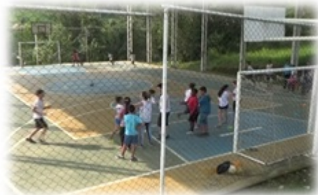
Figura 3 - Foto da vibração e interação entre alunos

Um aluno demonstrando estar extremamente feliz comentou: “nem acredito que fiquei até o final, esperava participar apenas”. Ele foi bastante resiliente em continuar o percurso, mesmo aparentando estar exausto. Para surpresa de muitos, pois, o mesmo não participava muito das atividades observadas anteriormente e assim não demonstrando interesse em atividades que exigiam esforço físico.