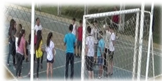
Figura 1 - Apresentação de imagens e fotos referentes ao atletismo

A primeira resistência à proposta apresentada se deu em função da predominante cultura do futebol como conteúdo hegemônico. E a partir daí, o questionamento provável, surgiu! Um aluno interrogou quando teriam futebol, com apoio e cumplicidade de muitos. (O autor)