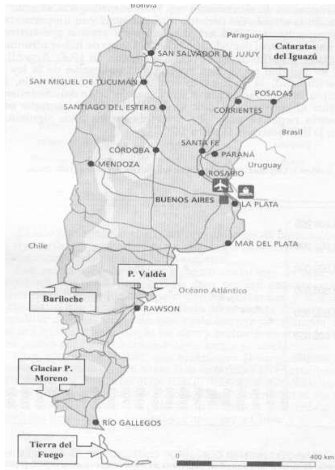
Mapa 1: Localización de los principales atractivos turísticos de Argentina