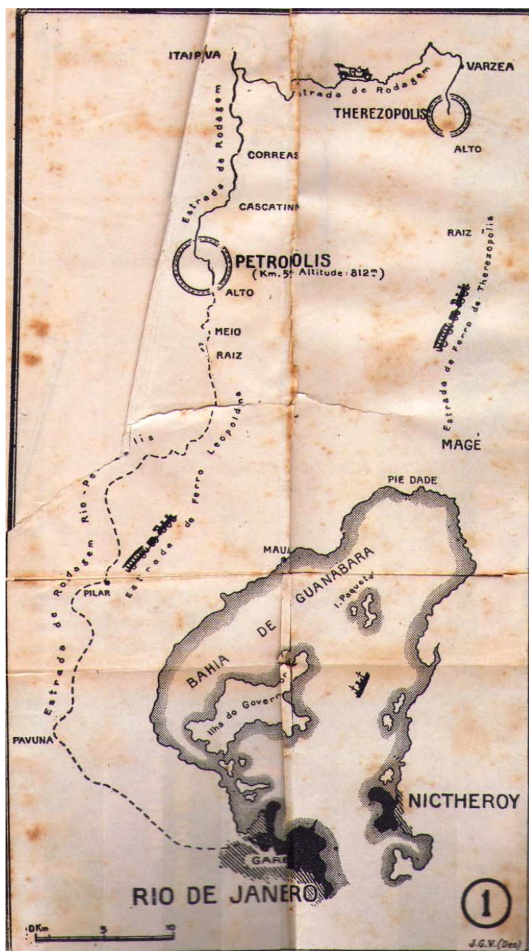
Figura 4: Mapa del camino de Rio de Janeiro a Petrópolis