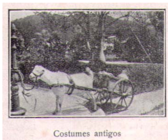
Figura 2: Costumbres antiguas