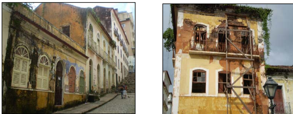
Figura 2: Caserones en ruinas y en estado de abandono

Muchos sitios están en franco proceso de deterioro y son blancos de depredación por parte de los pobladores locales; como el robo de azulejos de las fachadas de los caserones, que luego son vendidos a los visitantes; lo que representa la pérdida de importantes referentes para la memoria e identidad del barrio (Figura 2). Por otro lado, algunos caserones coloniales han sido ocupados de forma irregular por familias de segmentos sociales marginales; lo que impide el mantenimiento y la preservación del patrimonio cultural. Consecuentemente, se reducen las estrategias de promoción de la sustentabilidad temporal de estas construcciones.