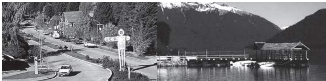
Foto 2: Vista aérea de San Martín de los Andes, Provincia de Neuquén