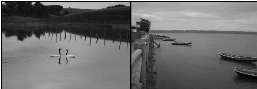
Figura 4: Patrimonio natural en el territorio Araucanía Costera