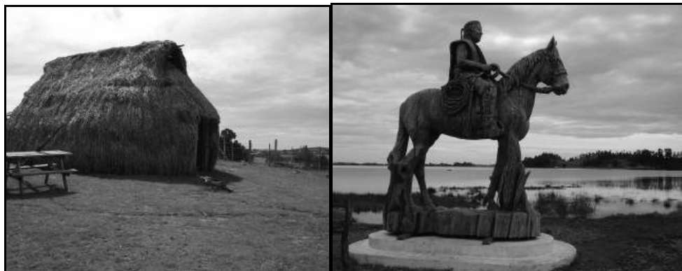
Figura 3: Patrimonio cultural en el territorio Araucanía Costera