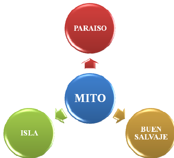
Figura 1: Elementos del Mito

La narración mítica no es una estructura estable sino que toma diferentes formas dependiendo de la época (Korstanje, 2011b) y la sociedad en que es interpretada y narrada. No es posible determinar si las similitudes entre mitos se deben a que evolucionaron de una versión primigenia universal o que en situaciones parecidas se crearían mitos parecidos. Para decantarse por una de las dos opciones de su origen sería necesario su análisis en épocas en las que aún no existía la escritura.