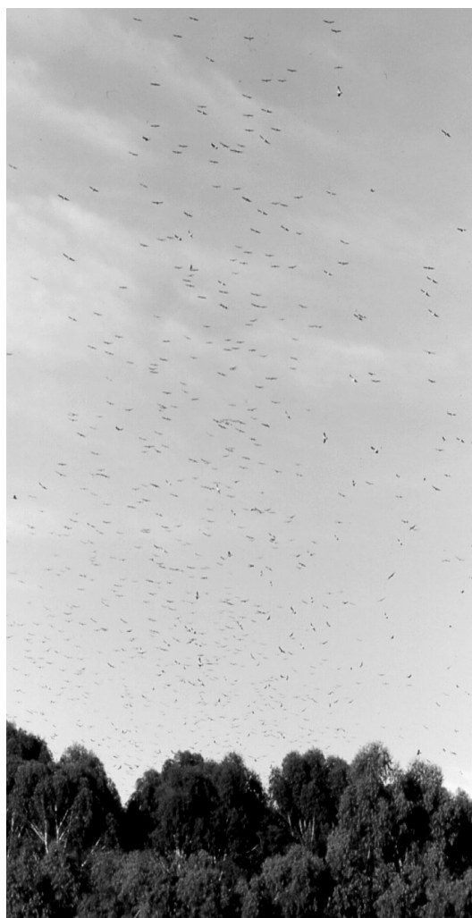
Figura 2. Individuos de Aguilucho Langostero ( Buteo swainsoni ) volando sobre una arboleda de Eucalyptus sp. en el norte de la provincia de La Pampa. Los aguiluchos seleccionan este tipo de plantaciones de especies exóticas como estructuras para establecer sus dormitorios comunales (Sarasola y Negro 2006).

de la misma o de otras especies de rapaces con las que compite por el uso del espacio (England et al. 1997). Durante este período, la dieta del Aguilucho Langostero es similar a la de otras especies del género y se compone principalmente de pequeños vertebrados (aves, mamíferos —especialmente ardillas terrestres del género Spermophilus — y reptiles; ver revisión en England et al. 1997). Sin embargo, tanto durante las agregaciones pre-migratorias como en el transcurso de la época no reproductiva en el Hemisferio Sur, la especie cambia completamente sus hábitos de