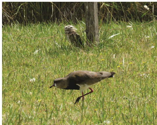
Figura 1. Lechucitas vizcacheras compartiendo el parche de nidificación con teros en un área periurbana del sudeste de la Provincia de Buenos Aires (Camet Norte, Partido de Mar Chiquita.).

Siguiendo los procedimientos y el diseño experimental de trabajos anteriores (Bryan y Wunder 2013, Cavalli et al. 2018a), en el presente trabajo expusimos