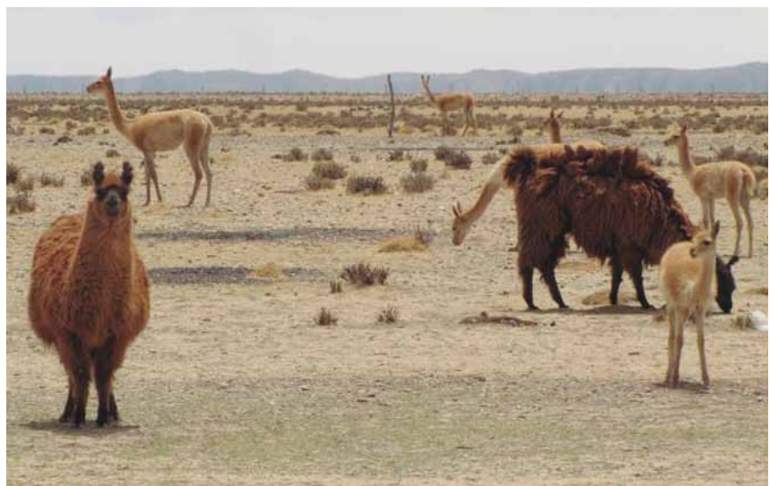
Figura 1. Vicuñas y llamas compartiendo unidades de vegetación en Santa Catalina (Jujuy).

Si bien los camélidos silvestres y domésticos tienen un diseño anatómico similar, se pueden apreciar notables diferencias fenotípicas: tamaño, color —tanto en los tonos como en su distribución corporal—, características del pelaje (bimanto menos marcado, etcétera). La distinción de variedades de alpacas y llamas es