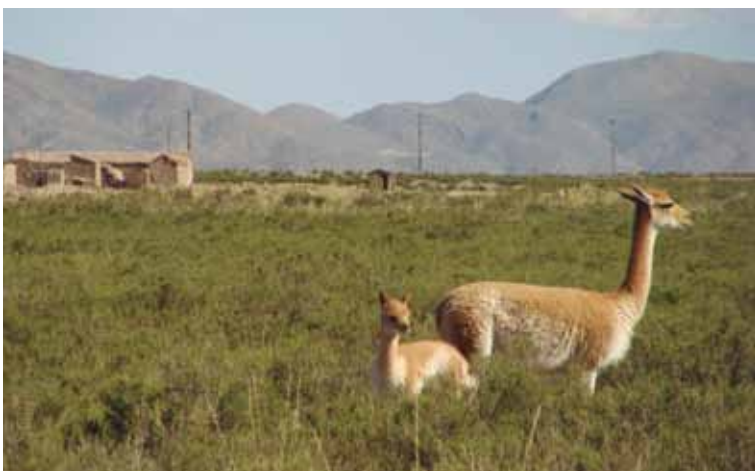
Figura 3. Vicuñas habituadas alimentándose muy cerca de viviendas en Santa Catalina (Jujuy). Fotografía: gentileza Yanina Arzamendia.