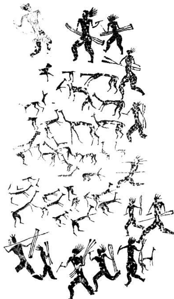
Figura 4. Representación de caza por encierro en el sitio 2Loa 15/13, Estilo Confluencia. Dibujo: Bernardita Bráncoli, gentileza de Francisco Gallardo. Nótese a las vicuñas en actitud de huida.

son diferentes, como así también es distinta la actitud de estos ante la presencia humana y la de los humanos frente a ellos, en el primer caso como cazadores, y en el segundo, como protectores de la manada.