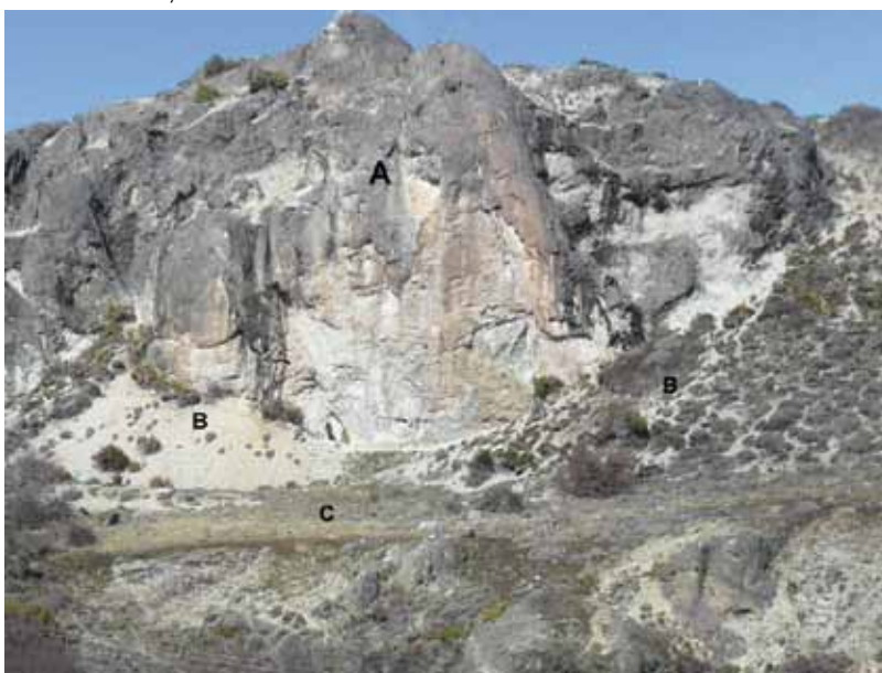
Figura 2. Sitio Acevedo 1, vista hacia el sur. A: Escarpa rocosa de brechas volcánicas. La roca se halla bajo intensa meteorización física por lajamiento y desgranación. B: Taludes de roca o escombros que provienen del till presente en la zona cumbre. Hay dos taludes, uno al N y otro al S del sitio, cuya adyacencia lateral forma una depresión donde se halla el sitio. C: Terraza glacifluvial formada por conglomerados.

El análisis zooarqueológico –que hasta el momento comprende los materiales recuperados en la cuadrícula F16, niveles 1 a 4 (excavación 2010) y parte de aquellos procedentes de las cuadrículas F15 y G15 (excavación 2012)– contabiliza 602 restos óseos y dentarios. De estos, el 30% son materiales indeterminados. Aquellos que fueron asignados a una categoría taxonómica corresponden mayoritariamente a restos de pequeños vertebrados, principalmente roedores, y unos pocos passeriformes. Entre los mamíferos de mayor porte se identificaron dos especímenes óseos de oveja ( Ovis aries ), uno de guanaco ( Lama guanicoe ), uno de zorro ( Lycalopex sp. ) y diez fragmentos de mamífero indeterminado (Tabla 1).