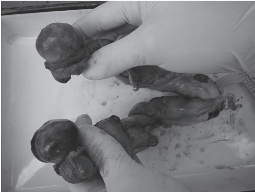
Imagen 1: tracto reproductivo luego de la ovariectomía.