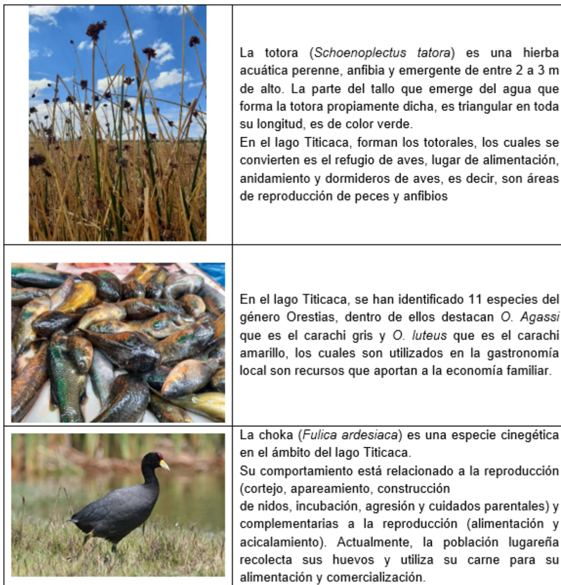
FIGURA 2 Características de las especies de mayor aprovechamiento en la RNT

Nota: Fotos tomadas por David Pineda - SERNANP