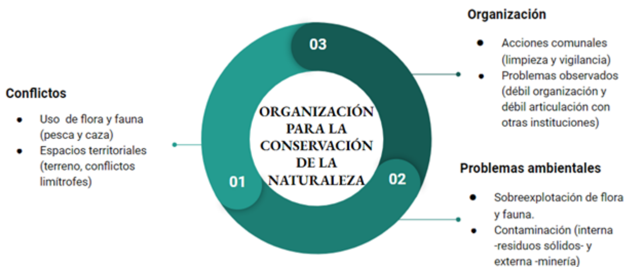
FIGURA 4 Organización para la conservación de la naturaleza

Nota: Elaborado en base a las entrevistas respecto al uso de flora y fauna en la RNT.