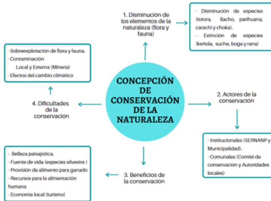
FIGURA 1 Concepción sobre la conservación de la naturaleza por los pobladores de la ZA-RNT

Nota: Elaborado en base a las entrevistas respecto a la conservación de la naturaleza.