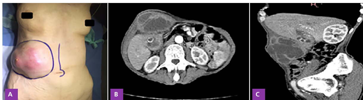
Figura 1 | A: Tumoración en hipocondrio y flanco derecho, eritematosa con secreción purulenta. B: Tomografía corte axial de abdomen con contraste endovenoso donde se evidencia voluminosa formación lacunar compleja, multilobulada y septada, incluida en el espesor de la pared abdominal. Presencia de colelitiasis. C: Corte sagital de abdomen con contraste endovenoso demostró por su margen posterior comunicación a la vesícula biliar, la cual presenta paredes engrosadas y macro litiasis

Hombre de 76 años quien no presentaba antecedentes patológicos de relevancia, consultó tras la aparición de tumoración dolorosa en flanco derecho, de 7 días de evolución, asociada a eritema cutáneo. Negó fiebre, vómitos y