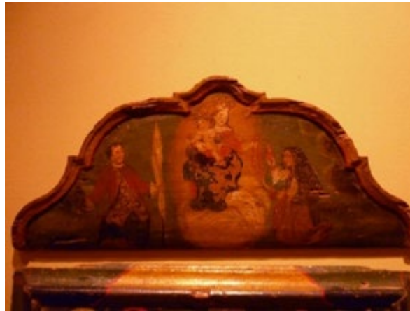
Imagen 1. Exvoto a la Virgen del Rosario, Siglo XVIII, Museo Colonial, Bogotá, Colombia.