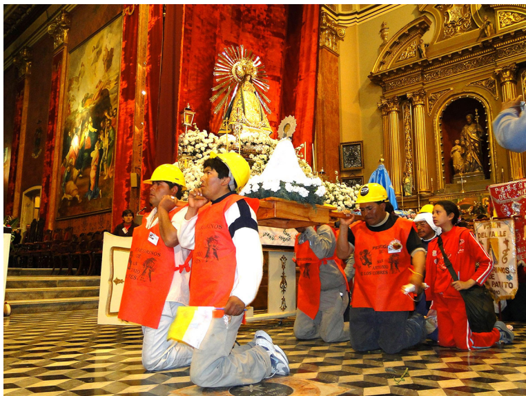
Figura 3. Llegada de las imágenes, 14 de septiembre de 2014.

Al mismo tiempo, la llegada a la Catedral y al centro de la ciudad salteña involucra un despliegue de prácticas devocionales y de rasgos diacríticos que distinguen a esta peregrinación (Figura 3). Los más visibles son los chalecos identificatorios y los cascos que los mineros usan durante todo el trayecto. 47 También la forma en que llevan sus imágenes: siempre mirando hacia el lugar de destino, pero cuando entran en la iglesia -como en los descansos- las hacen voltear hacia el lugar de dónde vienen. Según un cura de la ciudad, esto es algo característico de "la gente de la puna"; una forma de expresar "Vamos al santuario. Una vez que estamos en el santuario pedimos por nuestra tierra" 48 Y las prácticas que más miradas y cámaras atraen son, sin dudas, los bailes de jóvenes y niños/as vestidos/as de coya o de suri, junto a las bandas de sikuris, presentados como una "tradición" que "no se le pierde nunca". 49 Según afirma un minero, esa "es nuestra identidad", "es nosotros, es música nuestra, es música del altiplano, es música andina". 50