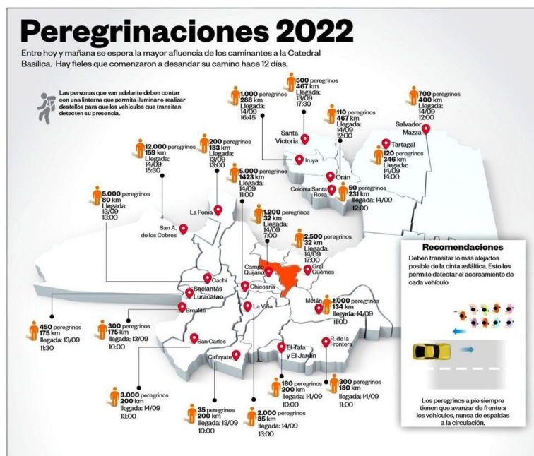
Mapa 1. Peregrinaciones al Santuario del Milagro registradas en 2022.

La experiencia de esta agrupación de caminantes me permitirá reflexionar sobre el santuario como geosímbolo provincial/nacional, y sobre la ciudad de Salta como hierópolis, partiendo de reconocer los dos niveles de espacialidad mencionados: el del alcance geográfico del santuario y el del espacio urbano sobre el cual se despliega el culto en su ritual anual, con sus fijos y flujos. A continuación, describiré cada uno de estos niveles y comentaré algunos de sus principales cambios y continuidades.