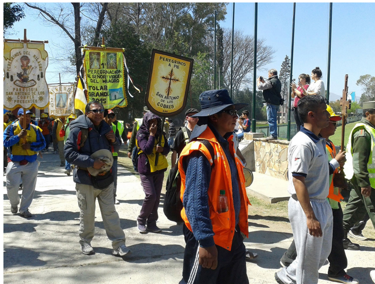
Figura 2. Llegada al Jockey Club, 14 de septiembre de 2015.

47. El chaleco implica una acreditación de identidad para obtener prioridad en distintas situaciones -comidas, descansos, camiones de equipaje-, como así también de paso en el operativo de llegada al santuario. Peregrinos de la Puna. [peregrinosdelapunaoficial]. (2022, 3 de septiembre). Comunicado Oficial . Instagram. Disponible en: https://www.instagram.com/p/CiDaV8DOaLg/ Según testimonios de quienes peregrinan, el problema es el uso de chalecos por parte de personas ajenas a la Puna -de Salta ciudad o "gente gringa"- que pueden comprarlos para acceder a esas prioridades o incluso recibirlos como parte de un paquete turístico.