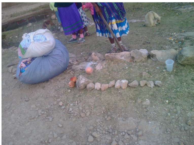
Figura 4. Hilera de piedras dispuestas en el suelo para (des)contar las vueltas dadas por los corredores durante una carrera de bola. Puede verse también una moruka sobre otra, las cuales contienen las prendas y telas que se han apostado en esta ocasión. Sierra Tarahumara, septiembre de 2015.

Al explicar el cuarto modo de contar, el de doce, Guadalajara señaló que nahògagui significa 48 y comenta que así “en fus juegos dizen algunos”. 7 Es claro que naó o nahó , significa cuatro y gagüi , ha dicho previamente, quiere decir ‘cerro’. Con esto sugiero la probabilidad de que se esté refiriendo a los circuitos de las carreras de bola o ariweta , a las distancias recorridas por los corredores dentro del circuito previsto. Aunque el autor del compendio tiene otros intereses, no etnográficos, sí sugiere que para los rarámuri del siglo XVII los espacios y distancias amplias que el patrón de asentamiento disperso o la geografía serrana obligan a considerar pudieron haber sido medidos o contados de una manera particular, distinta probablemente a los espacios y distancias cortas. De este modo, sus datos sugieren que algunos juegos, que aún hoy llevan a muchos rarámuri a la congregación en medio de la dispersión, debieron representar una práctica cotidiana y que la acción de contar el espacio o la distancia tenía, tal vez, como particularidad simplificar el conteo de medidas extensas.