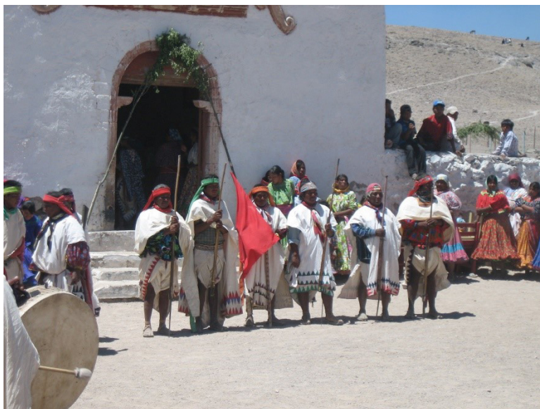
Figura 2. Seis autoridades rarámuri a la espera de emitir sus discursos durante la ceremonia. Fotografía de Abel Rodríguez López, Sierra Tarahumara, abril de 2011.

La referencia al empleo del número doce la hace Artaud al hablar sobre el número de piezas dancísticas que, al parecer, fueron ejecutadas en aquella fiesta del peyote que él presenció. Así dice que, “entre los dos soles [esta ceremonia comienza por la tarde al ocultarse el sol y termina al amanecer cuando el sol sale] hay doce tiempos en doce fases” (Artaud, 1998: 64), con lo cual muestra una relevancia del número doce en el conteo de las piezas dancísticas, las cuales muy probablemente se realizarían de cuatro en cuatro o quizá de tres en tres en función del género -femenino o masculino- de la persona por quien se realizaba la ceremonia. De acuerdo con autores como Velasco Rivero, ([1983] 2006), hablar de la danza, en este contexto, no es sino referirse a un elemento constitutivo no solo de la ceremonia sino de la vida de los rarámuri. Una cuestión mayor que Artaud aporta es su referencia al orden ritual como el que permite la organización, el orden y la objetivación del entorno a quienes participan en este. Aspectos que asimilan, desde este punto de vista, la ritualidad al deporte y al juego.