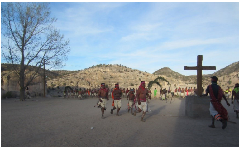
Figura 3. En número de cuatro los danzantes -llamados fariseos- se dirigen al interior de la iglesia, mientras otro tanto sale de ésta para hacer una guardia por breves momentos como símbolo de la aprehensión de Jesucristo. Fotografía de Abel Rodríguez López, Sierra Tarahumara, 2022.

La referencia al empleo del número doce la hace Artaud al hablar sobre el número de piezas dancísticas que, al parecer, fueron ejecutadas en aquella fiesta del peyote que él presenció. Así dice que, “entre los dos soles [esta ceremonia comienza por la tarde al ocultarse el sol y termina al amanecer cuando el sol sale] hay doce tiempos en doce fases” (Artaud, 1998: 64), con lo cual muestra una relevancia del número doce en el conteo de las piezas dancísticas, las cuales muy probablemente se realizarían de cuatro en cuatro o quizá de tres en tres en función del género -femenino o masculino- de la persona por quien se realizaba la ceremonia. De acuerdo con autores como Velasco Rivero, ([1983] 2006), hablar de la danza, en este contexto, no es sino referirse a un elemento constitutivo no solo de la ceremonia sino de la vida de los rarámuri. Una cuestión mayor que Artaud aporta es su referencia al orden ritual como el que permite la organización, el orden y la objetivación del entorno a quienes participan en este. Aspectos que asimilan, desde este punto de vista, la ritualidad al deporte y al juego.