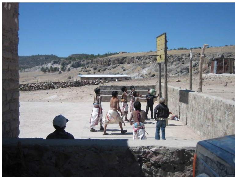
Figura 5. Infancias rarámuri jugando basquetbol en un descanso de sus danzas. Sierra Tarahumara, abril de 2011.

En la diversidad de juegos que practican los rarámuri actuales, y que se distinguen de los antedichos en su menor práctica, no hay que olvidar tanto la baraja como la pelea de gallos -casi exclusivos de hombres adultos- el voleibol y el basquetbol -que practican sobre todo las infancias y jóvenes rarámuri cuando asisten a los internados de religiosos y religiosas católicas- así como los promovidos por el estado mexicano en centros educativos que casi siempre cuentan con espacios que favorecen la práctica de estos deportes. En estas prácticas, llama la atención que las tandas de juego se deciden, preferentemente, por resultados de diez y doce como lo hemos comprobado jugando basquetbol con algunos jóvenes rarámuri en el internado de Tewelichi. Asimismo, no hay que olvidar la práctica del béisbol, deporte impulsado por algunos jesuitas en los comienzos del siglo XX y practicado más por los blancos y mestizos, pero hoy en día también por algunos rarámuri que habitan poblaciones predominantemente mestizas.