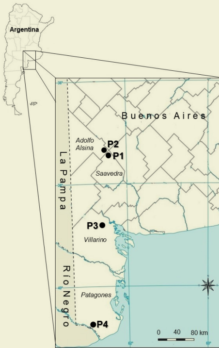
Figura 1. En el detalle del mapa de Argentina se indican las áreas donde se recolectaron las semillas de las cuatro poblaciones (P1, P2, P3 y P4) de Pappophorum vaginatum Figure 1. The detail of the map of Argentina shows the areas where the seeds of the four populations (P1, P2, P3 and P4) of Pappophorum vaginatum were collected

con cobertura de estrato herbáceo. En la zona de recolección de P3 la precipitación media anual histórica (1959 a 2010) es de 648,5 mm. La temperatura media anual es de 15,4 °C y las medias anuales máximas y mínimas son de 22,8 °C y 9 °C. Las temperaturas máximas y mínimas absolutas son 43,8 °C (enero) y -11,8 °C (julio). La humedad relativa media anual histórica (1960 a 2014) es 63,7% (Servicio Meteorológico Nacional: SMN, 2017). El relieve es una llanura ondulada con lomas arenosas con cobertura de estrato herbáceo y comunidades