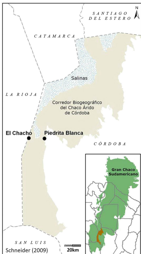
Fig. 1. Área de Estudio.

las sierras de Pocho y Guasapampa. El paisaje, en general, está caracterizado por la escasez de aguas superficiales —tanto corrientes como estancadas (ANPs de Córdoba 2005). En líneas generales el suelo del piedemonte es poco profundo, contiene pocos nutrientes, es arenoso y permeable, y arcilloso y fino en la llanura (Demaio & Medina 1999).