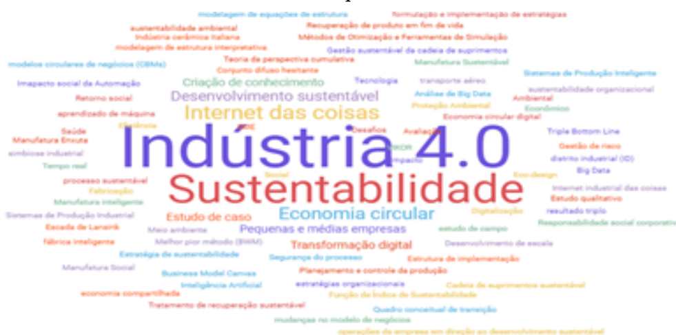
FIGURA 4: Nuvem de palavras

Foi realizado o levantamento das palavras-chave utilizadas pelos autores dos 20 artigos selecionados, para identificar quais termos são os mais citados. Foram identificadas 79 palavras-chave diferentes. A figura 4 ilustra através de uma nuvem de palavras a representatividade de cada termo citado nas pesquisas analisadas. Os termos de maior destaque foram “Indústria 4.0” e “Sustentabilidade”, como era o esperado, tendo em vista que os mesmos foram utilizados para a busca dos estudos nas bases de dados.