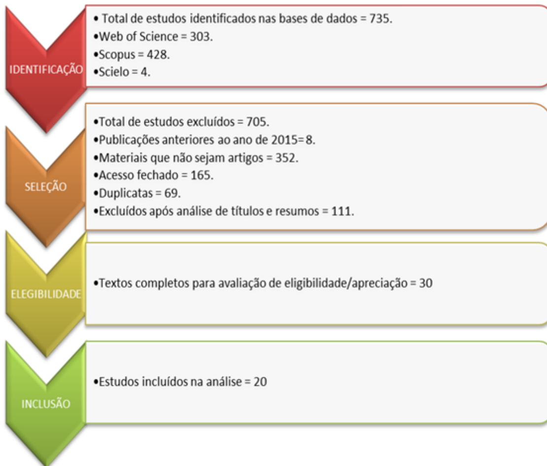
FIGURA 2: Fluxograma do processo de seleção dos estudos a partir da metodologia PRISMA