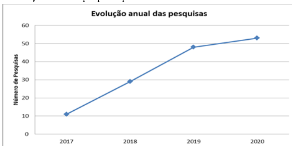
FIGURA 1 Evolução anual das pesquisas que envolvem indústria 4.0 e sustentabilidade

O levantamento utilizando as expressões “ Industry 4.0 ” e “ sustainability ” nas bases de dados escolhidas teve como retorno, um total de 735 estudos. Após a utilização dos critérios de inclusão e exclusão tivemos os seguintes resultados: No critério “Publicações anteriores ao ano de 2015”, foram eliminados apenas 8 artigos, no critério “materiais que não sejam artigos”, foram eliminados um total de 352 materiais, como revisões sistemáticas, livros e capítulos de livros, no critério “Acesso fechado”, foram eliminados 165 artigos, no critério “Duplicatas”, foram retirados os artigos duplicados nas bases que somavam 69 artigos, restando após esta etapa 141 artigos, que foram utilizados para a elaboração do gráfico abaixo, que demonstra o crescimento da pesquisa sobre indústria 4.0 e sustentabilidade nos últimos anos. Podemos verificar claramente o crescimento da pesquisa sobre o tema e não podemos deixar de considerar que para o ano de 2020 foi considerado o dia 03 de setembro como data de corte e novas pesquisas poderão ser incluídas neste período.