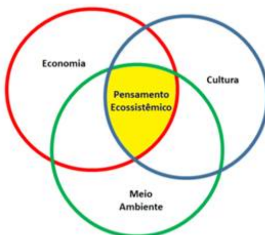
FIGURA 1 Estrutura de uma relação ecossistêmica.