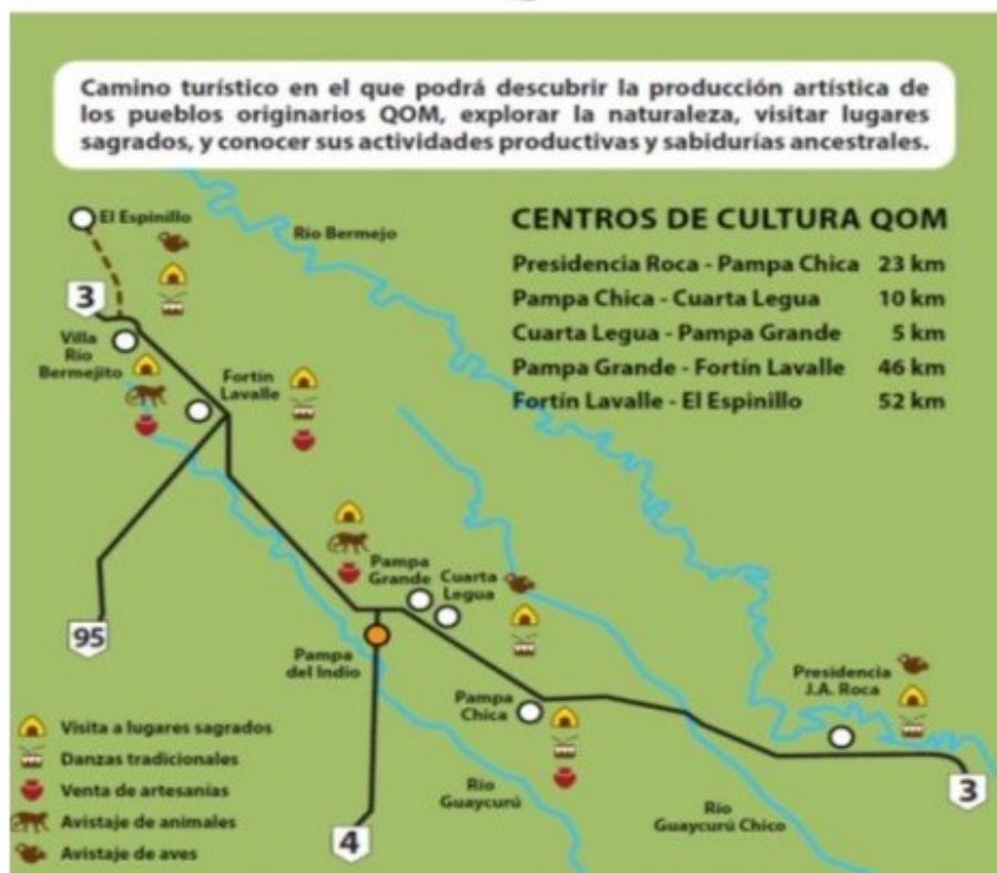
Imagen 4. Imagen emplazada en carteles a lo largo de la Ruta Provincial N° 3

Imagen disponible en documento del Banco Mundial: http://caminosrurales.org.ar/caminos-rurales-2018/pdf/dial/4_1_Miriam_Garcia_Lorenzana_Banco_Mundial.pdf (Fecha de última consulta 31 de diciembre de 2020)