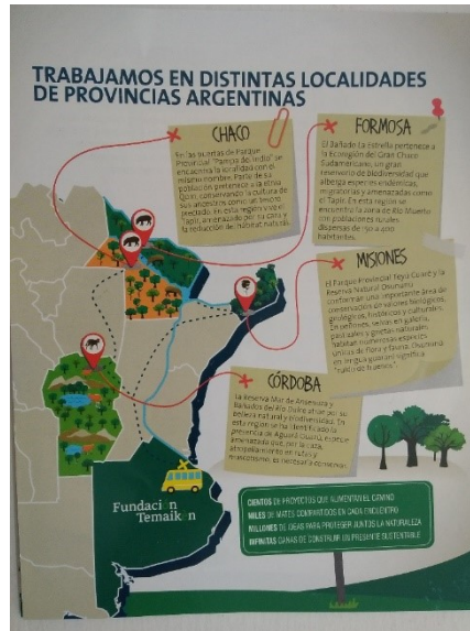
Imagen 3. Folleto sobre el programa de Multiplicadores Ambientales implementado por la Fundación Temaikén en la localidad de Pampa del Indio, a partir de su participación en el proyecto EFEM

el tapir, las comunidades saben que es importante que este el bicho y si queremos comerlo o cazarlo hay que hacerlo con cuidado” (Fernando, entrevista realizada en Temaikén octubre 2017). En este sentido, la fundación aparte del parque zoológico realiza diversos proyectos de conservación animal. Uno de ellos es la capacitación a actores locales donde los técnicos de la fundación enseñan a los pobladores los beneficios de cuidar las especies nativas a través de prácticas responsables de caza [Imagen 3].