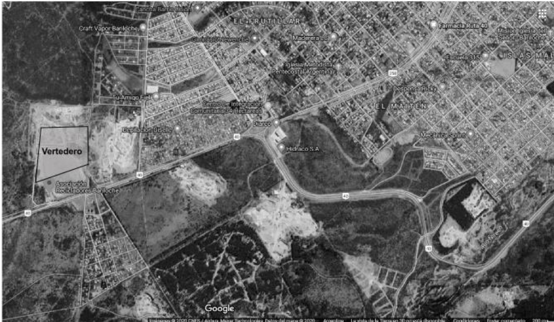
Figura 1. Ubicación geográfica del Vertedero Municipal.