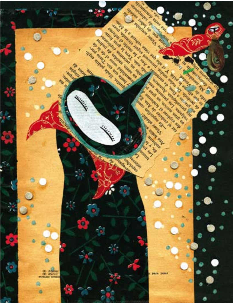
Sin título, ilustración digital. Mariela González

Fecha de Aceptación: 9 de agosto de 2015