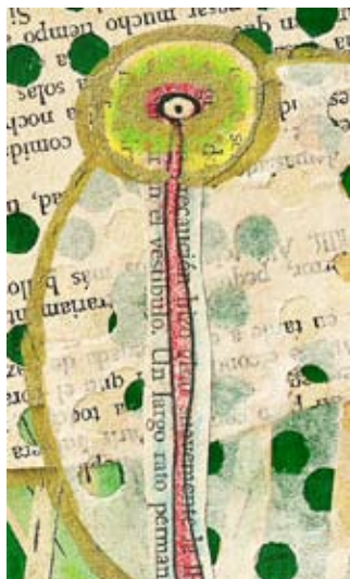
Detalle “Cabeza verde”, ilustración digital. Mariela González