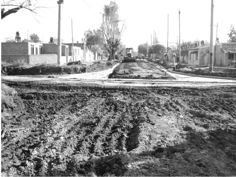
Figura 4. Cabín 9, Año 2011: intervención del PROMEBA

desde la década de 1970, no hemos accedido a información para caracterizarla demográficamente desde tal período. 14