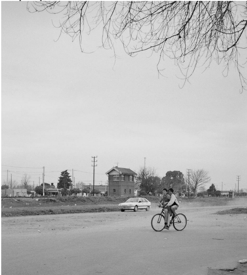
Figura 1. Cabín 9, Año 2005: Cabina del ferrocarril desde la parada del transporte público

El barrio de Cabín 9 se formó a la vera del Ferrocarril Oeste Santafesino a principios del siglo pasado: su nombre corresponde a la cabina ubicada sobre la vía que corta el trazado del barrio en dos sectores (Figura 1).