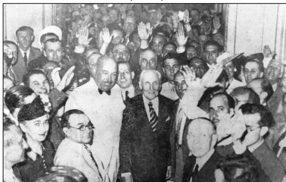
Imagen 2: Inauguración de la sede social de la Casa de España con presencia del Embajador de España, Antonio Magaz y Pers (1940)