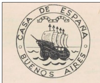
Imagen 1: Membrete de la Casa de España